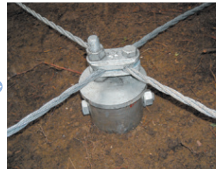
6 アンカー頭部取付け。(Bアンカー)