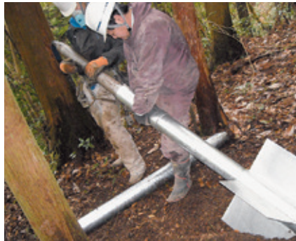
2 エアパンチャーをアンカーに挿入し、エアパンチャーにて試掘した試掘孔にアンカー本体を立てこむ。