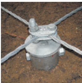
Bアンカー(交点部用)