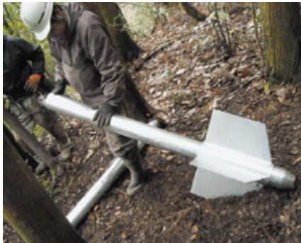
1 クロスウィングにアンカー本体を挿入する。