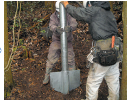
3 クロスウィングの羽根は、ロープ方向に沿わせるようにし、エアパンチャーにて打込む。