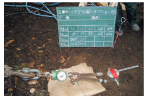
アンカーに各試験荷重をかけ、許容変位(10cm)を超えないこと。