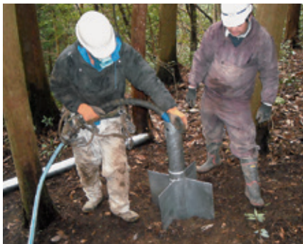
4 アンカー本体を打込むと、本体に取付けた凸部によりクロスウィングが同時に打込まれる。