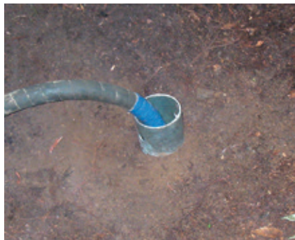
5 クロスウィングアンカー打設完了。