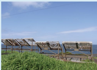
三宅島試験場風景